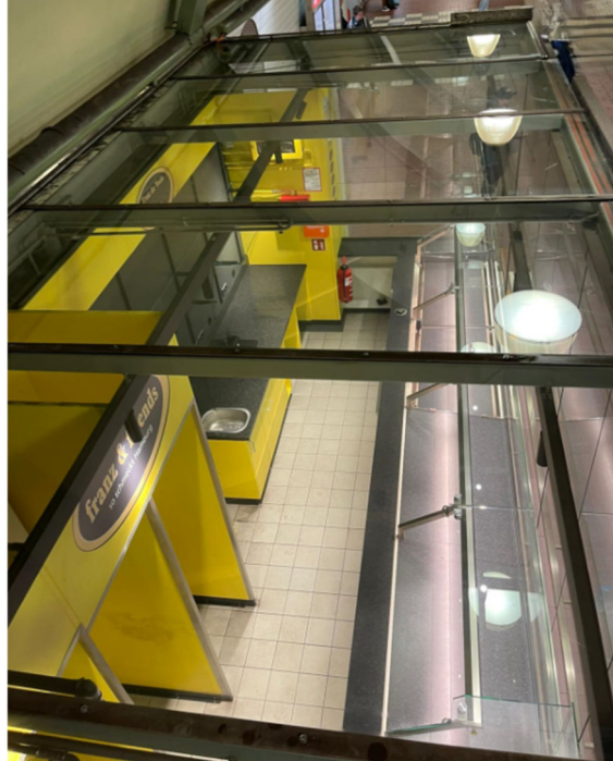
Abbildung 6: Bahnsteigspavillon von oben

Die Heizung wird nicht vom Vermieter geliefert. Der Mieter ist für eine genügende Heizung der gemieteten Ladenfläche verantwortlich. Die Fassade wird durch einfach verglaste Schiebeelemente verschlossen. Verfügt somit nicht über einen geeigneten Einbruchschutz. Was es als Betreiber nötig macht, die Ladenfläche täglich von Wertgegenständen und Waren zu räumen.