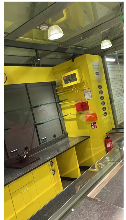
Abbildung 3-5: Bahnsteigspavillon inkl. Einrichtung