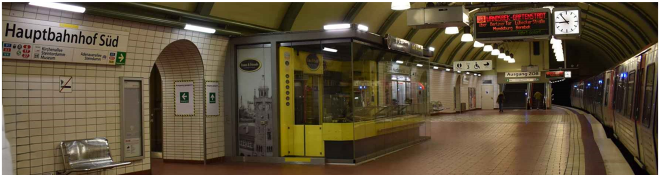
Abbildung 1: Bahnsteigspavillon