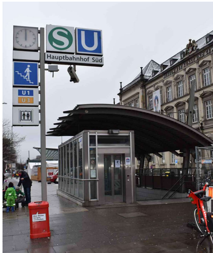
Abbildung 1: Zugang Halle D (Steintordamm)