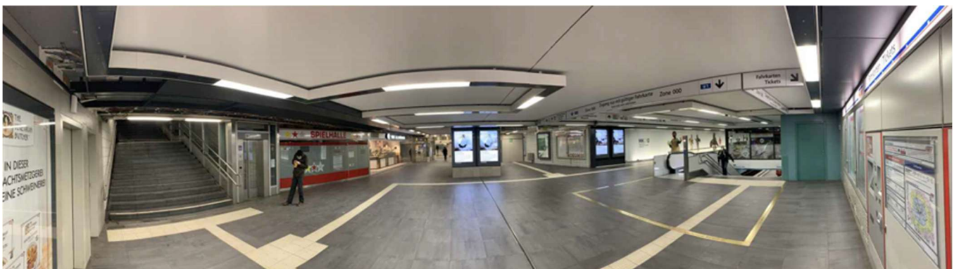
Abbildung 3: Schalterhalle D

Fettabwasser und Küchenabluft sind nicht vorhanden und nicht genehmigungsfähig. Auf Grund dessen ist der Gastronomiebetrieb ausgeschlossen.