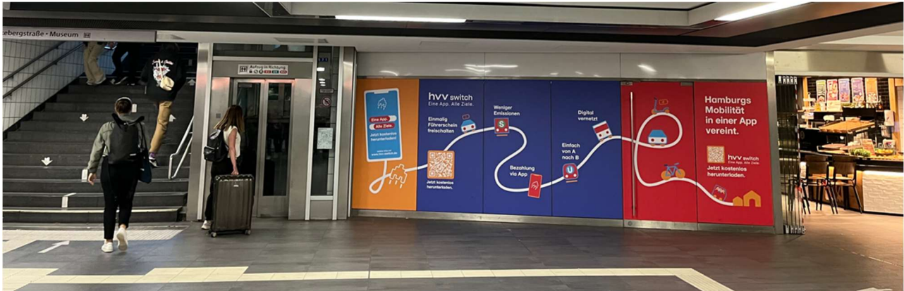
Abbildung 4: Ladenfläche U-Bahn-Haltestelle Hauptbahnhof Süd

Die Ladenfläche verfügt über eine Zuluft Erwärmung. Die Kosten werden separat ermittelt. Die Erwärmung dient lediglich dazu, Frostschäden zu vermeiden. Der/die Mieter*in ist für die Einhaltung der Arbeitsschutzrichtlinien seiner Mitarbeiter*innen betreffend verantwortlich.