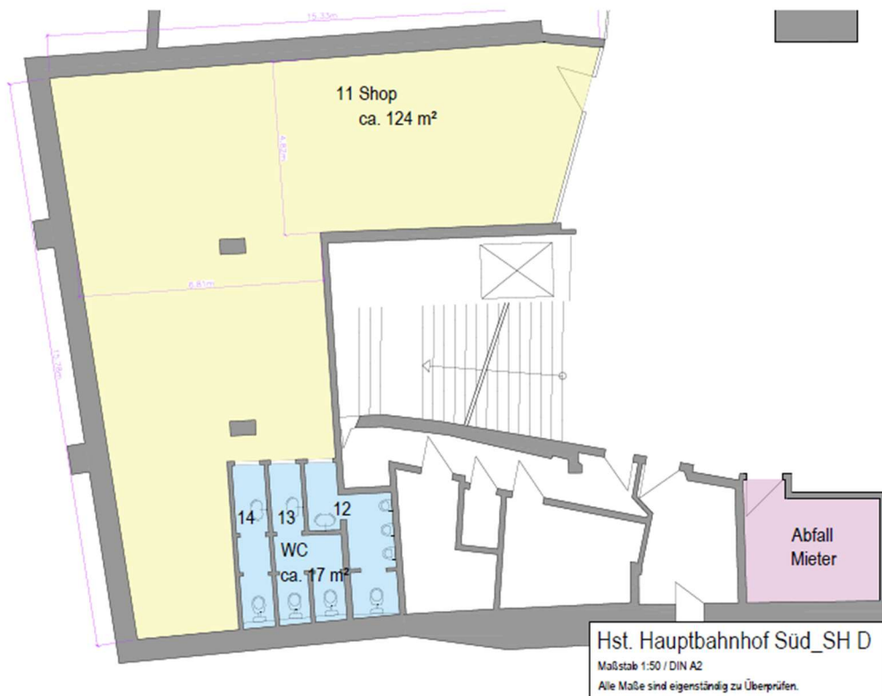
Abbildung 5: Grundriss Ladenfläche inkl. Müllraum

Die bestehende Stromleistung ist derzeit auf 28,0 kW begrenzt.