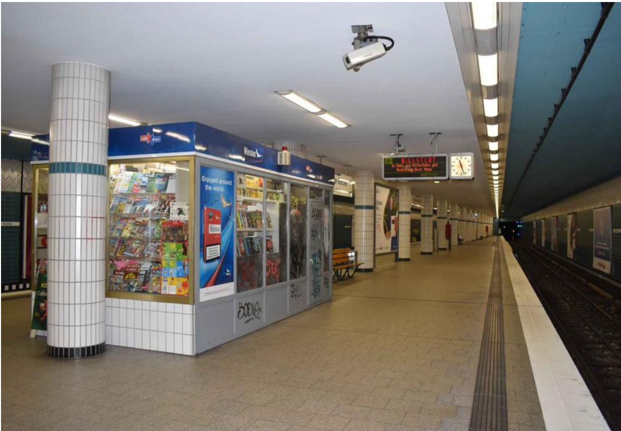
Abbildung 1: Ehem. Bahnsteig-Kiosk