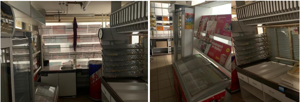
Abbildung 4: Inneneinrichtung Ladenfläche U-Bahn-Haltestelle Hammer Kirche

Die Ladenfläche verfügt über eine Zuluft Erwärmung. Die Kosten werden separat ermittelt. Die Erwärmung dient lediglich dazu, Frostschäden zu vermeiden. Der/die Mieter*in ist für die Einhaltung der Arbeitsschutzrichtlinien seiner Mitarbeiter*innen betreffend verantwortlich.