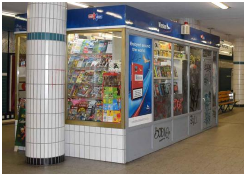
Abbildung 3: Ehem. Bahnsteig-Kiosk

Fettabwasser und Küchenabluft sind für die angebotene Mietfläche nicht vorhanden und nicht genehmigungsfähig. Auf Grund dessen ist ein Gastronomiebetrieb ausgeschlossen.