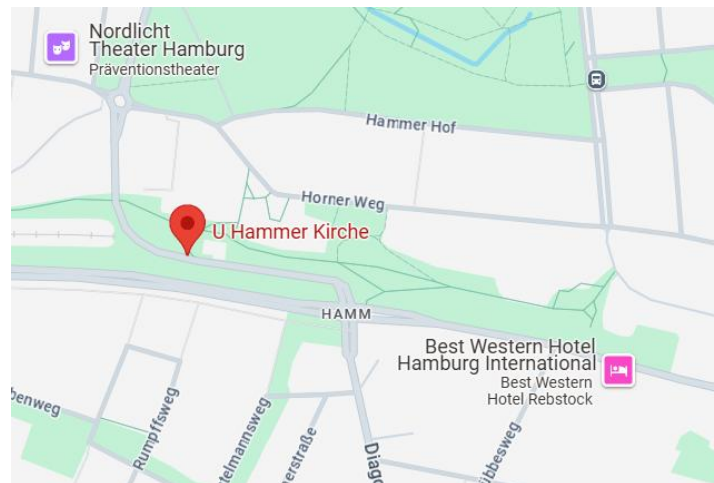
Abbildung 2: Lage in Hamburg U-Bahn-Hst.: Hbf. Süd

Die Haltestelle befindet sich östlich der Hamburger Innenstadt. In der unmittelbaren Nähe findet man u.a. Büro- und Wohngebäude, Parks, sowie verschiedene Einkaufsmöglichkeiten, Theater, Hotels und Restaurants.